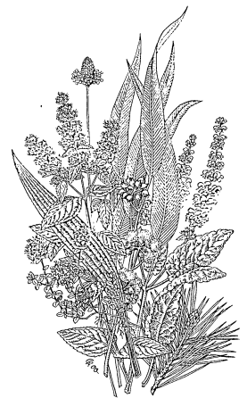
Heilpflanzen im WALA-Garten