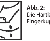
Abb. 2: Die Hartkapsel mit der Fingerkuppe herausdrücken.