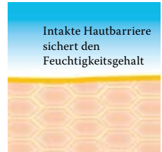
Intakte, schützende Hautbarriere mit Linol-säure-reichen Lipiden.

Besuchen Sie uns unter www.linola.de . Denn dort haben wir für Sie alle aktuellen Informationen über Linola Hautmilch , Linola Gesicht , Linola Hand und Linola Fuß-Milch sowie zu weiteren Linola-Produkten bei verschiedenen Hautproblemen bereitgestellt.