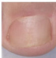
Dopo il trattamento

Se non osserva miglioramenti dopo 3 mesi deve consultare il medico.