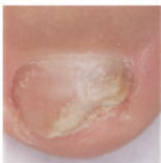
Prima del trattamento

E' importante proseguire il trattamento con lo smalto medicato fino alla completa risoluzione dell'infezione e alla completa rigenerazione dell'unghia. In genere occorrono circa 6 mesi di terapia per le unghie delle mani e da 9 a 12 mesi per le unghie dei piedi. Lei vedrà l'unghia sana ricrescere con il ridursi dell'unghia malata.